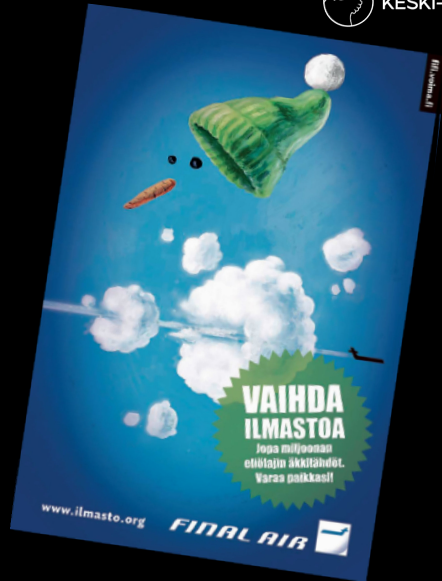
Voima Kustannus -verkkosivut