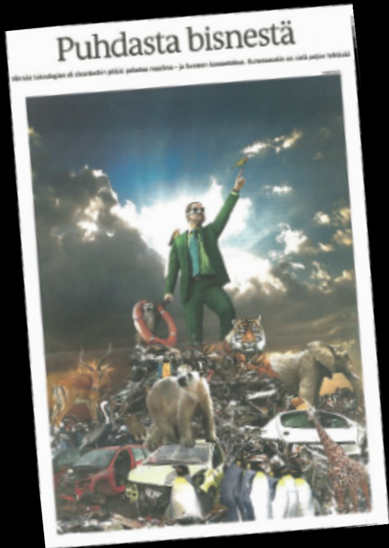
Helsingin sanomat (HS) 20.2.2011